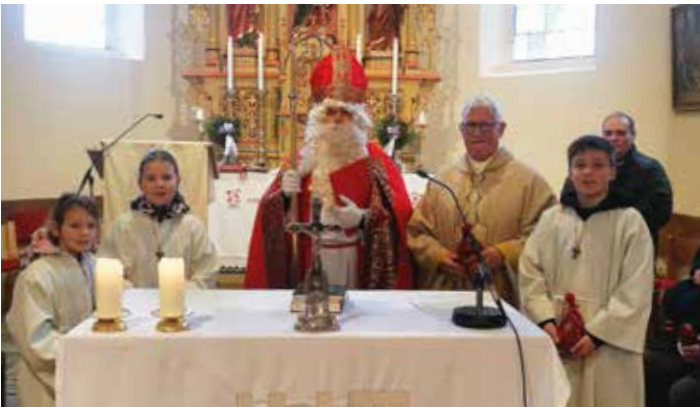
Der Nikolaus besuchte die Kinder nach der Heiligen Messe. Die Pfarrgemeinde bedankt sich für die Spenden.