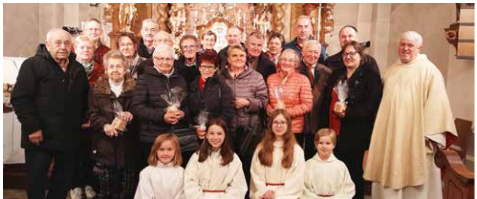
Feier der Ehejubiläen 2026