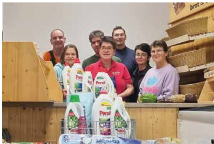
Eine großartige Sammlung für den Sozialmarkt in Zwettl - Danke!