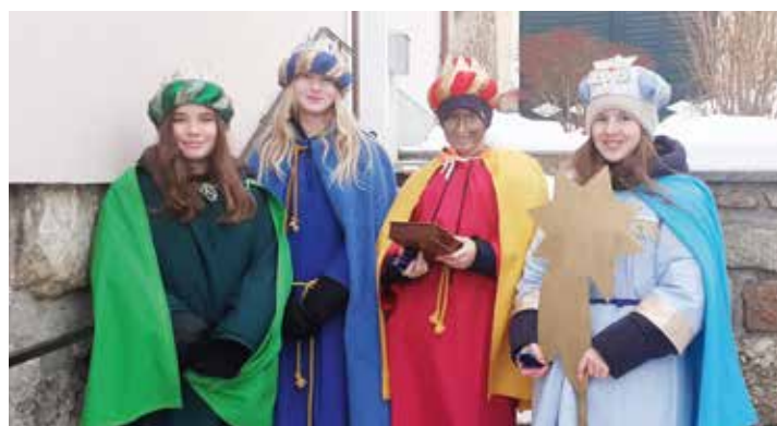
Sternsingergruppen - danke den Kindern und euren BegleiterInnen!