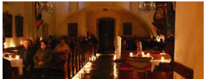
Rorate in der Pfarrkirche Altmelon

Zur Unterstützung des Kirchenchores und Familienchores werden Sänger und Sängerinnen gesucht.