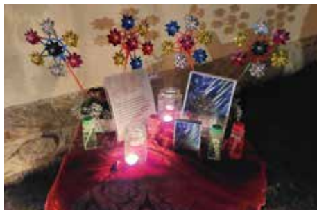
„Bruder Wind, Luft und Wolken“ war eine der 8 Stationen bei der Nacht der 1000 Lichter.