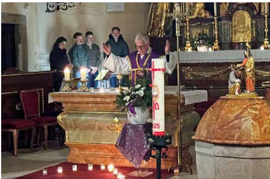
Roratemesse in den Morgenstunden Warten auf das Kommen des Lichts, Jesus Christus.