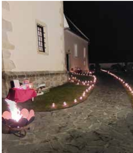
Nacht der 1000 Lichter - Ein großes DANKE an all die fleißigen Helfer.

Heuer werden die Ortschaften Schönbichl, Antenfeinhöfen und Rafelshöfe gebeten die Birken zu spenden und beim Aufstellen zu helfen. Für die Erntekrone sind sie dieses Jahr auch verantwortlich. DANKE.