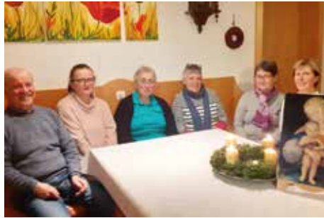
„Herbergsuchen“ in Langschlag und Umgebung