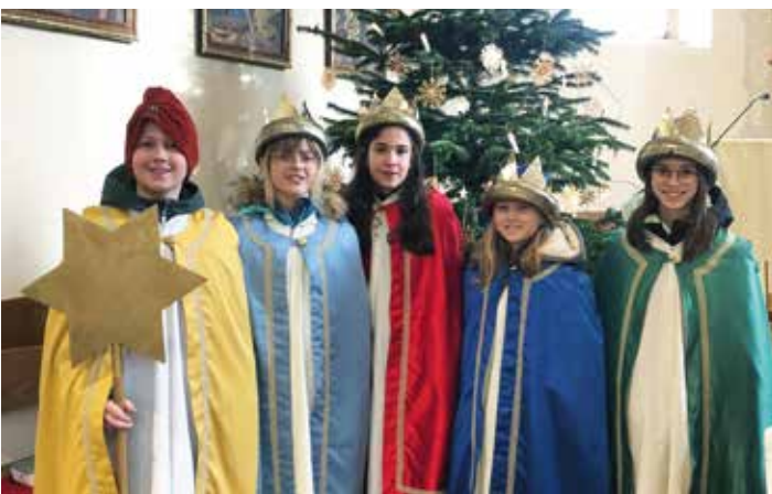
Die Sternsingergruppen brachten den Segen von Haus zu Haus.