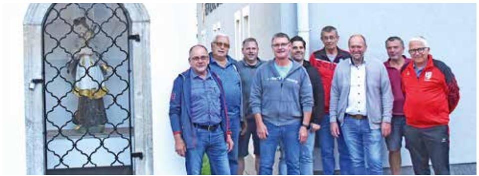
Segnung des renovierten Nepomuk-Marterls beim FF-Depot.

Herzlich willkommen zum Pfarrheurigen nach dem Sonntags- gottesdienst im Pfarrhof-ZELT!