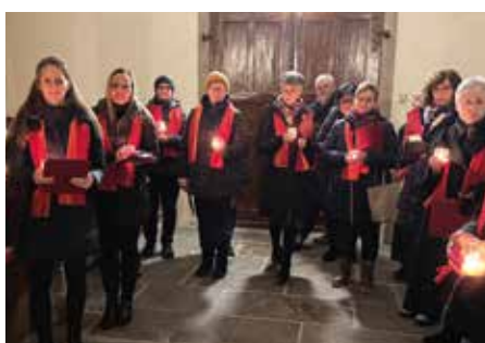
Evensong - Abendlob - Zwischen Warten und Sehnsucht