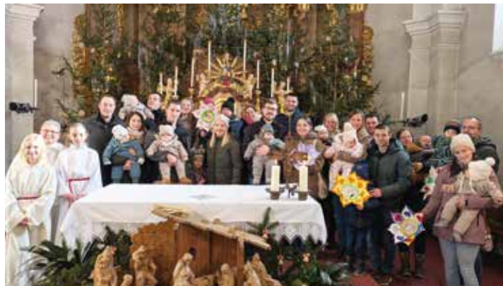
Wortgottesfeier mit Rückgabe der Taufblumen.