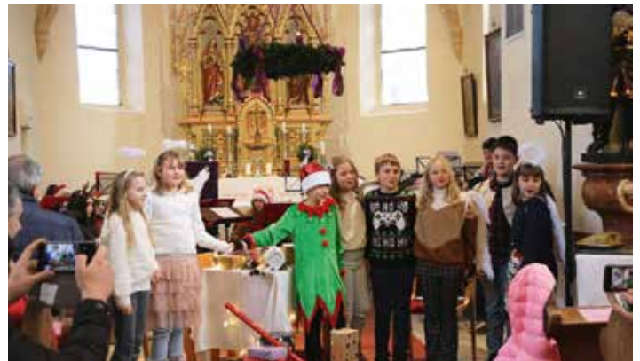
Adventsingen - Auch heuer gestalteten das Altmeloner Jugendorchester, der Musikverein und die VS Altmelon das besinnliche Adventkonzert in der Pfarrkirche.