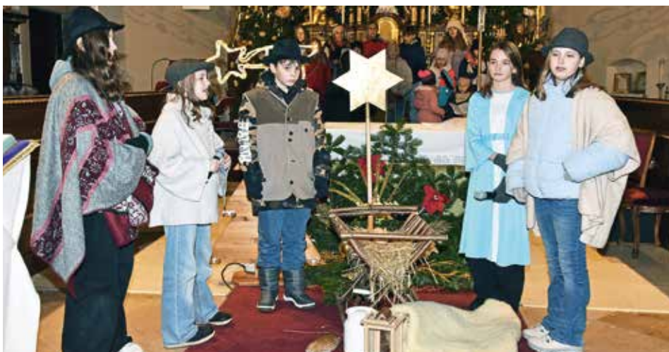
Eine stimmungsvolle Kinderweihnacht