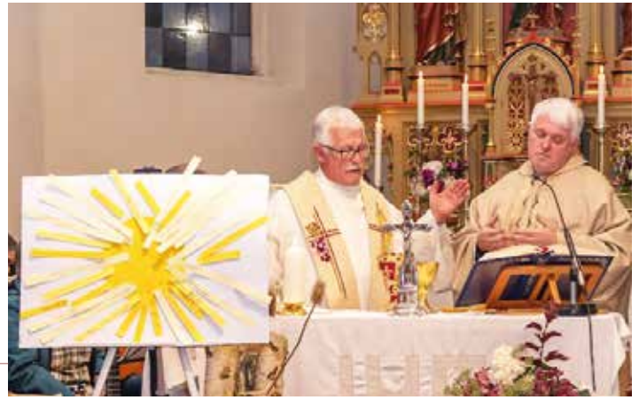
Franziskusmesse - Der gesamte Pfarrverband beteiligte sich an der Gestaltung der Franziskusmesse in Altmelon.