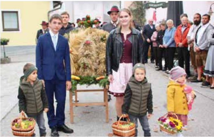
Erntedankkrone - Dorfgemeinschaft Perwolfs