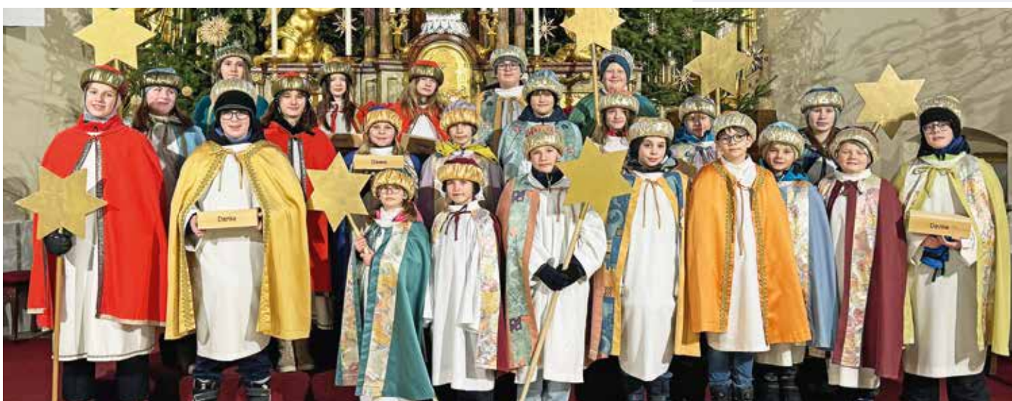
Sternsinger Motto - Gemeinsam Gutes tun. 7 Sternsingergruppen brachten die Frohe Botschaft in unsere Häuser!