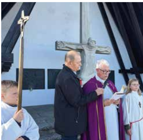
Allerheiligen - Wir erweisen den Gefallenen und Verstorbenen unserer Pfarre ein ehrendes Andenken.