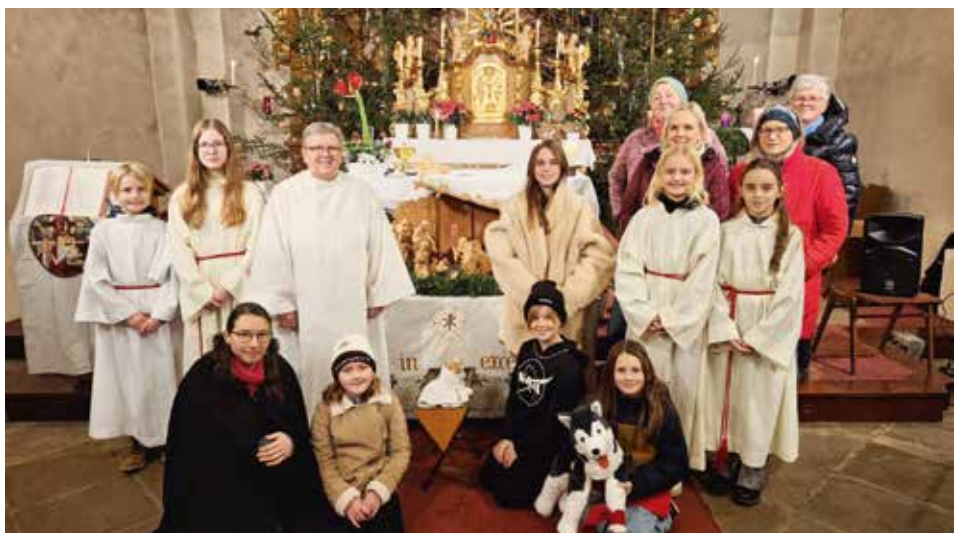
Kinderweihnacht in Langschlag - danke euch Kindern und Frauen!

Und wie klein kann ein Feuer sein, das einen großen Wald in Brand steckt.