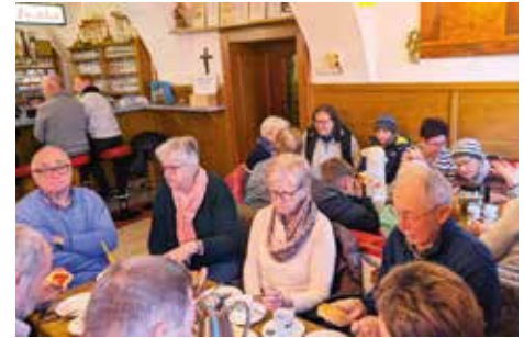
Roratemesse und Frühstück - danke der Dorfgemeinschaft Langschlägerwald & Kainrathschlag