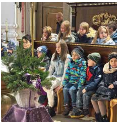
Arbesbacher Adventssonntag - „Licht im Advent“ - Hoffnung, Besinnlichkeit, Freude!