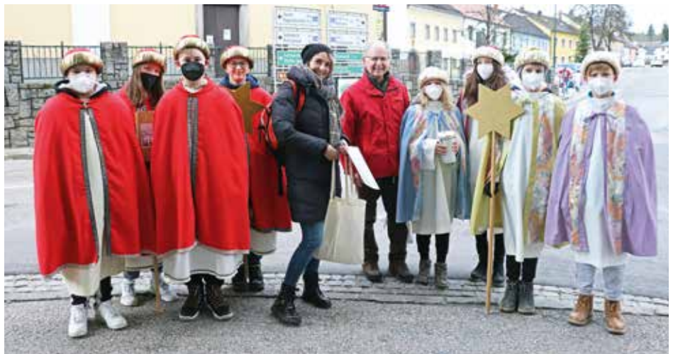
Acht Starnsingergruppen brachten den Segen in die Häuser und sammelten für Notleidende.