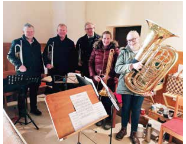
Danke ebenso dem Bläserensemble für die besonders festliche Gestaltung der Weihnachtsmessen.