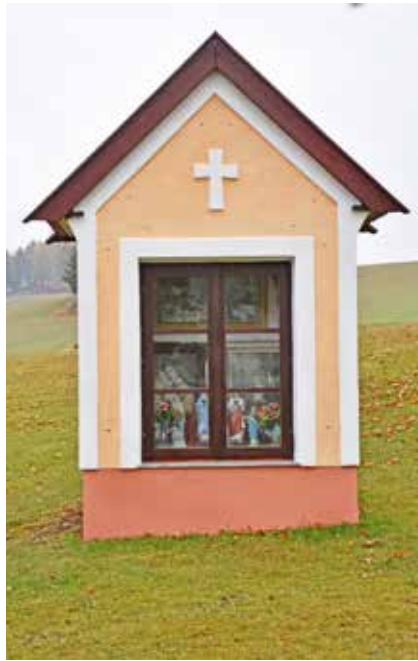
Neurestauriertes Marterl in Schmerbach (Projekt: 72 Stunden ohne Kompromiss)