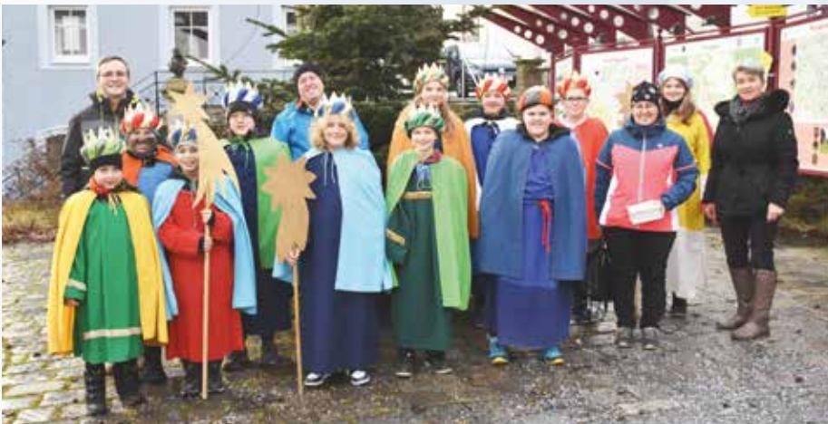
Sternsingeraktion 2022 Langschlag