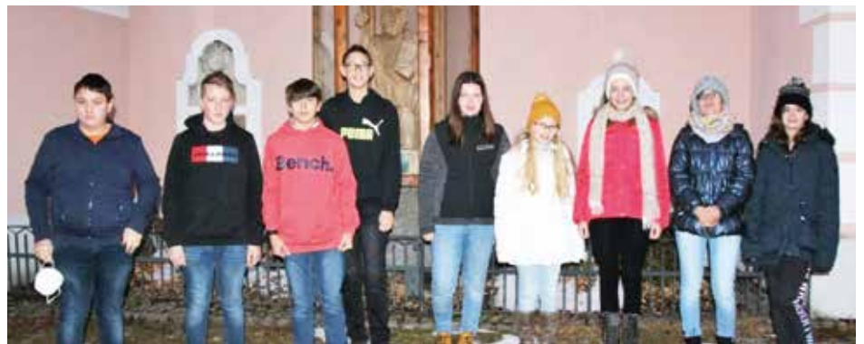
Unsere diesjährigen Firmlinge aus der Pfarrgemeinde Altmelon.