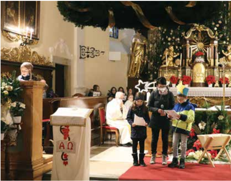
Sehr gut besuchte Kinderweihnacht – Volksschulkinder lasen die Geschichte vom Stern des Friedens.