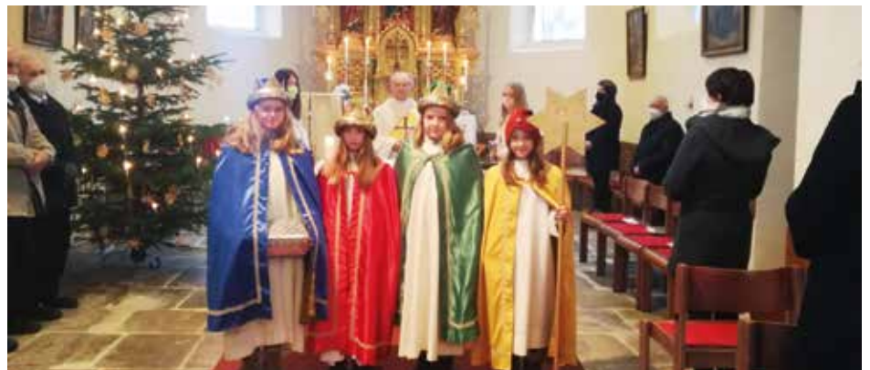
Heuer konnten unsere Kinder als Sternsinger wieder von Haus zu Haus ziehen und Spenden für eine bessere Zukunft für Menschen in Not sammeln.